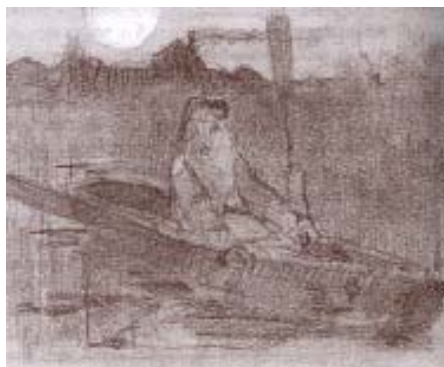
Н. К. Рерих. Охотник в лодке. Рисунок. Ок. 1890 г. Б., кар., акв., белла. В свету 8,8x11,7

Ряд набросков того же времени объединяет мотив сидящих в лодке охотников – «Охотник в лодке» (1889–1890), «Двое охотников в лодке» (1889–1890), «Охотник в лодке» (ок. 1890). Последний рисунок отличается и по технике, и по настроению. Он близок к лирическому. По сравнению с изображениями, выполненными тушью, здесь более тонко проработаны руки и