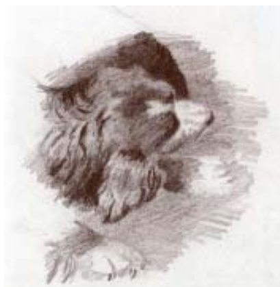
Н. К. Рерих. Бекас. 19 июля 1893 г. Б., кар. В свету 10x9,8

Теме охоты посвящены ранние (уже профессиональные)