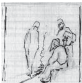
Н. К. Прях. Убюстра. Набросок. 1889–1890 гг. Б., тушь, кар. В свету 5,5x5,7

[2, с. 11] относятся рисунки тушью «Охота на медведя» (1889–1890) и «Охотники в лесу» (1889–1890). В наброске «Охота на медведя» фигуры людей и зверя показаны тёмным силуэтом в движении. Композиция напоминает первобытные изображения, на которые