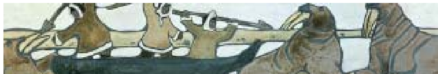
Н. К. Рерих. Каменный век. Север. Охота на моржей. Проект фриза для майолики. Кар., гуашь 12х62

ходящемся в мемориальном собрании С. Митусова в Санкт-Петербурге.