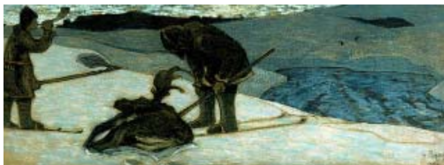
Н. К. Рерих. Север. 1902. Б., пастель, гуашь. 34x89

В письме Н. Рериха к Е. Шапошниковой от 22 августа 1900 г. упоминается эскиз, сюжетом которого является охота на кабана, выполненный в Окуловке [8, с. 183]. Возможно (по предположению В. Мельникова), речь идёт об эскизе («Охота», 1900–1901), на-