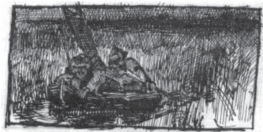
Н. К. Рерих. Двое охотников в лодке. набросок. 1889–1890 гг. Бум., тушь. В свету 4,9x10,1

стера, но уже в них угадываются черты «рериховского стиля». Настроение передано посредством пейзажа, а о смысле происходящего можно судить по жестике и движениям обобщённых фигур. В линейном наброске «У костра» (1889–1890) также намечены «рериховские» особенности изображения фигур и тематика раннего творчества (на наброске имеется надпись: «Жрец сидит»).