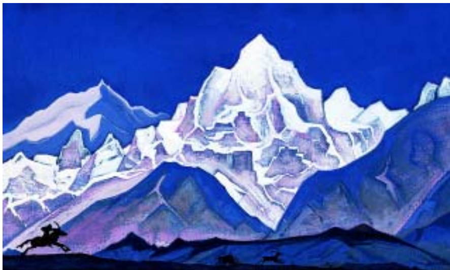
Н. К. Рерих. Охота. 1937 г. Х., темпера. 46x79

ма, то это панно решено как линейно-плоскостное, т. е. чисто декоративное. В такой же манере исполнен эскиз декоративного фриза для майолики «Каменный век» (1907) со сценами рыбной ловли и охоты. В целом его декоративный строй напоминает иероглифическое письмо. Тема охоты также присутствует в панно «Поморьяне. Утро» (1906).