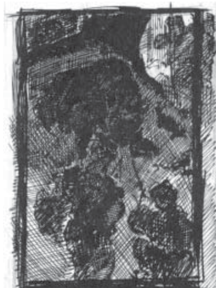
Н. К. Прях. Охота на медведя. Набросок. 1889–1890 гг. Б., тушь, кар. В свету 13,3x10,3