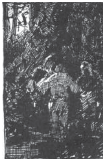
Н. К. Прях. Охотники в лесу. Набросок. 1889–1890 гг. Б., тушь, кар. В свету 8,7x5,6

[2, с. 11] относятся рисунки тушью «Охота на медведя» (1889–1890) и «Охотники в лесу» (1889–1890). В наброске «Охота на медведя» фигуры людей и зверя показаны тёмным силуэтом в движении. Композиция напоминает первобытные изображения, на которые