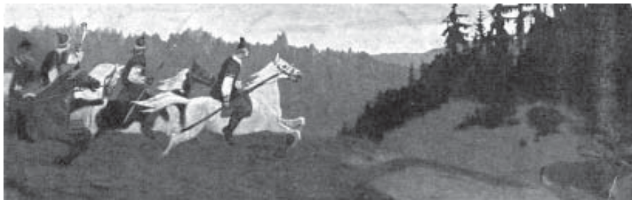
Н. К. Рерих. Княжья охота. Утро. Вариант. 1901 г.

В монографии 1916 г. [9] приведена чёрно-белая репродукция картины «Княжья охота. Утро», обозначенная как вариант. В отличие от известной картины, здесь меньше динамики, что подчеркнуто вытянутым по горизонтали и почти параллельным раме контуром дальнего леса. В этом варианте нет бегущих рядом со всадниками собак. В монографии вариант датирован 1901 годом, а также указано, что первоначально он находился в собрании Ве-