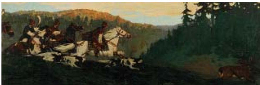
Н. К. Перих. Княжья охота. Утро. 1901 г. Х., л. 121x350

теми же названиями выставлялись в Академии художеств на весенней выставке 3 марта 1902 г. Там было представлено известное нам произведение «Княжья охота. Утро», хранящееся ныне в Воронежском областном музее изобразительных искусств. На фотографии 1902 года художник показан стоящим с кистью в руках именно перед этой картиной. Правил ли он парижский вариант или же это совершенно новое панно, точных сведений об этом нет. Известно только, что обе картины предназначались «для дворца его высочества принца Петра Александровича в Рамони», о чём сообщалось в прессе [11, с. 31].