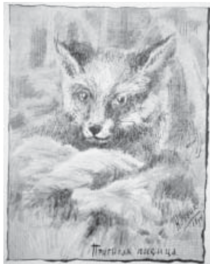
Н. К. Рерих. Прибылая лисица. 1894 г. Б., тушь, кар.

произведения Н. Рериха: «Княжья охота. Утро» (1901) и «Княжья охота. Вечер» (1901). Вариант первой картины был написан ещё во время пребывания в Париже в мастерской Ф. Кормона, о чём художник сообщал в письме к А. Половцову: «По-прежнему нарочито работаю; слышу большие похвалы от Кормона <...>. Кроме рисунков, этюдов и эскизов за это время написал две картины. 1 – «боги» (из славянской древности). 2 – охота (тоже из старины)» [7, с. 147]. Картина, по совету Ф. Кормона, была выставлена в Парижском салоне. Оба панно с