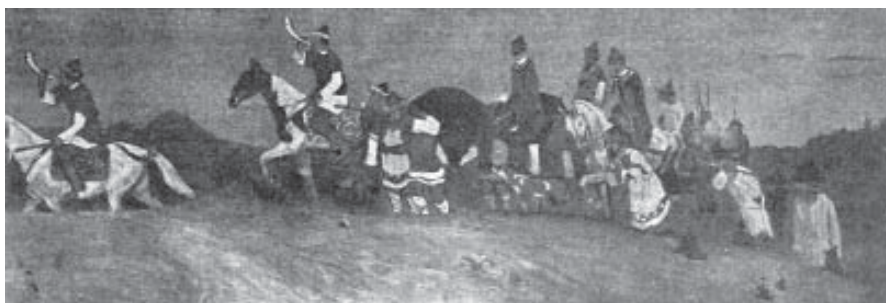
Н. К. Перих. Княжья охота. Вечер. 1901 г. Х., л. 121x350

На картине «Княжья охота. Утро» изображена группа охотников на конях, преследующих лося. Динамичный характер произведения подчёркнут вытянутым по горизонтали форматом. Ком-