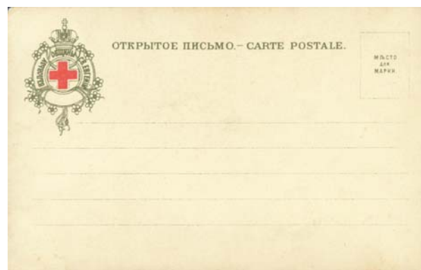
Оборотная сторона (адресная) открытых писем, изданных в 1901–1902 годах

ства Общины в Комитет популяризации художественных изданий, на оборотной стороне открытых писем печатали либо название организации, либо издательскую марку Комитета, автором которой был Л. Хижинский.