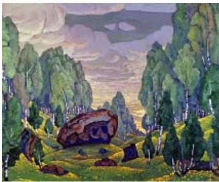
Н. К. Рерих. Декорация к весенней сказке «Снегурочка» А. Н. Островского «Урочище». 1912. ГРМ

В декорации Н. К. Рериха к весенней сказке «Снегурочка» А.Н. Островского «Урочище» (1912, ГРМ). Камень занимает в композиции центральное место и также, как в некоторых вариантах эскизов к «Весне священной», выполняет роль алтаря. Он окружен небольшими камнями и священной березовой рощей. Холмы, на которых растут деревья и находятся камни, покрыты желтыми весенними цветами. Здесь все в движении: и деревья, и холмы, и облака, только камень статичен. Он служит олицетворением вечного, нерушимого и связан с деревьями в структуре священного алтаря [5, С. 125].