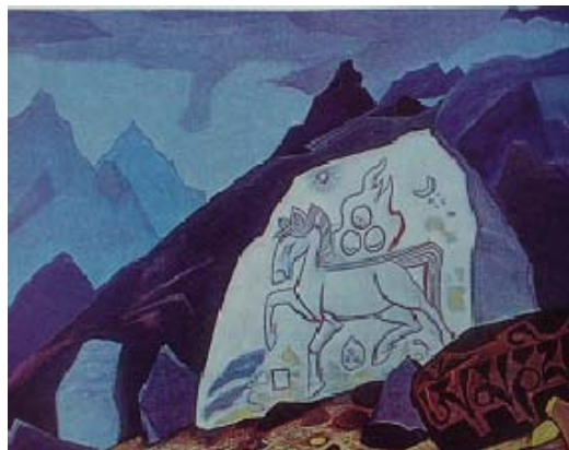
Н. К. Рерих. Знак Чинтамани (Белый камень, или Конь счастья). 1933. Музей им. Н. К. Рериха, Нью-Йорк

Скалы-великаны с антропоморфными ликами можно видеть на картине, написанной в более поздний период творчества Рериха – «Сокровище мира – Чинтамани» (1924, Музей им. Н. К. Рериха, Нью-Йорк). Произведение выполнено в пурпурово-коричневых тонах со всполохами синего цвета. На фоне величественных скал глубокого ущелья, имеющих антропоморфные черты, по каменной узкой тропинке