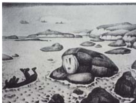
Н. К. Рерих. Великанша Кримгерд. 1915. ГРМ.

В своих произведениях Рерих часто использовал реально существующие археологические находки. Так и здесь, по мнению Е. П. Маточкина «в качестве прототипа краеугольного камня мироздания Рерих взял уникальный шедевр искусства викингов – Йеллинский камень» [7, С. 194]. Йеллинский камень представляет из себя кусок гранита в виде неровной трехгранной пирамиды. На ее центральной плоскости изображено Распятие, на правой – руническая надпись. На левой грани – резьба в виде зверя, похожего на грифона или льва, стоящего на трех лапах. Тело зверя кольцами охватывает змея. Художник показывает две грани – центральную и левую, со зверем. Образ распятого Христа здесь олицетворяет добро, а фантастическое животное – зло. Все изображения вовлечены в живую вязь из переплетающихся лент и узлов, подобно какому-то растению. То есть, здесь христианские и языческие образы представляют из себя единое целое, что характерно для художников-символистов.