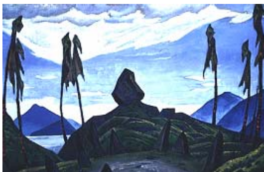
Н. К. Рерих. Эскиз декорации к «Весне священной». 1930. Музей им. Н. К. Рериха, Нью-Йорк

В третьем варианте декорации к балету «Весна священная» И. Ф. Стравинского «Поцелуй Земле» (1912, Астраханская картинная галерея им. Б. М. Кустодиева) место священного Древа занимает камень. Это продиктовано самой сценической постановкой. Дерево мешало бы танцующим артистам и отвлекало бы внимание зрителей. Сам художник в письме к И. Ф. Стравинскому писал: «делаю вариант первого акта, без дерева получше» [8, С. 446]. Но дерево имело символическое значение, и потому его нужно было заменить не менее значимым образом. Место дерева на пригорке, окруженном камнями, занял огромный поставленный вертикально рябой валун. Камень показан над небольшим озерцом за которым возвышается пологая округлая гора. Вертикально установленные камни «символизируют axis mundi (символами которой являются также дерево, гора, дерево на горе <...>) и указывают на верховную поддержку всего сущего во вселенной» [5, С. 126]. Изображенный Рерихом валун близок к конической или даже пирамидальной форме. Такой формы камни имеют также фаллическую символику. В контексте данного произведения роль axis mundi выполняет вероятнее всего гора, а камень, изображенный над озером, – равновесие мужского и женского начал, гармонию Небесного и Земного. Духовного и материального.