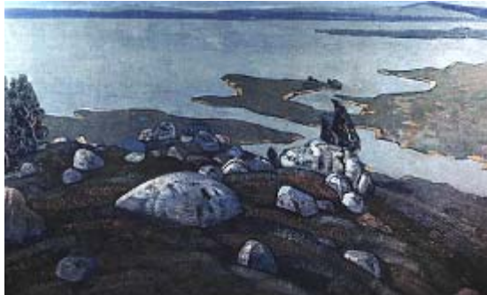
Н. К. Рерих. Могила великана. 1915. Государственный музей Востока. Москва

Одна из главных тем в творчестве Н. К. Рериха – тема камня. По утверждению С. К. Маковского, – «если спросить Рериха, что он больше всего любит, он ответит: камни» [6, С. 81]. Маковский также пишет о том, что образ камня сближает таких художников как Рерих и Врубель. Он отмечает, что «и в живописи Врубеля есть начало каменное. Разве не из хаоса чудовищных сталактитов возник его «Сидящий Демон», написанный еще в 1890 году <...>. Не высечен ли из камня, десятью годами позже, и врубелевский «Пан» <...>? Такой же и «Богатырь» Врубеля <...>, изваянный вместе с конем страшилищем из глыбы первозданной» [6, С. 82]. В упомянутых произведениях Врубеля доминирует начало хтоническое. В его «Демоне» кристаллическое мерцание дает неустойчивую форму, то есть форма начинает дематериализовываться. У Рериха, наоборот, все камни имеют четкую и конкретную форму, кроме того, несут смысловую символическую нагрузку.